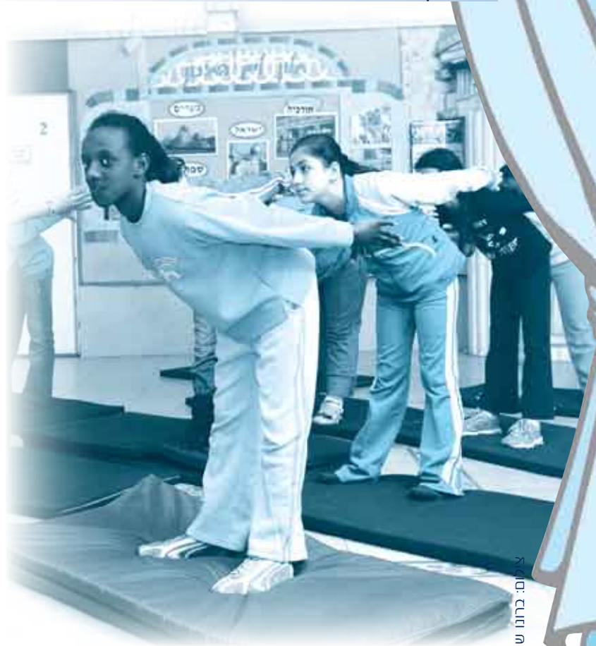
צילום: רחוב שריטי

“כל יום אני מבינה כמה לא הבנתי וחשבתי שאני יודעת... בעיקר בתחום האישי רגשי. השינוי הוא משמעותי והשפיע על כל תחומי החיים של בית הספר: באווירה, בתחושת הצוות. יש צמיחה בלתי רגילה של המורים. התפתחה שפה רגשית ורגישה, וזה שינה את היחסים בינינו לבין עצמנו ובקשר עם הילדים, והתקרבו מאוד להורים. כניסת העובדת הסוציאלית יחד עם הצוות הכי-מקצועי יצרו תחושה שאנחנו לא לכד יותר...” מדבריה של מורה, אחרי ארבע שנים שבהן פעלה התכנית.