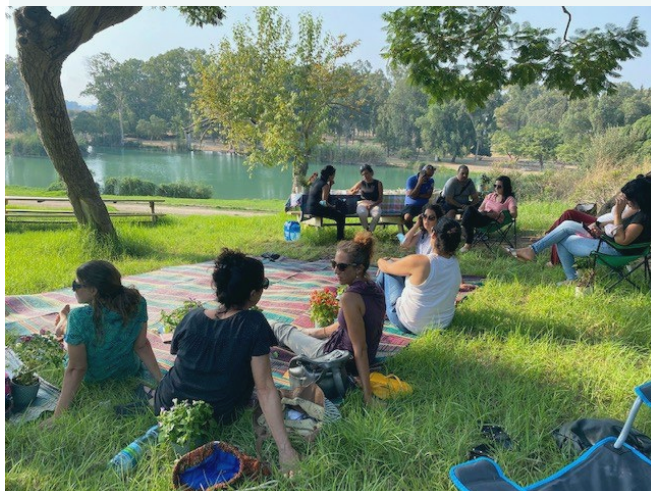
מפגש שנה טובה לצוות הארצי והמחוזי

אתגרים רבים לפנינו, נמשיך בתהליכי ההסתגלות והיערכות למציאות החדשה וננסה לקדם ידע ופרקטיקות חדשניות לשיפור מצבן של משפחות החיות בעוני והדרה חברתית. כלל המחוזות והמטה הארצי עוסקים בגיבוש תכנית עבודה לשנה הקרובה שמקדמת את נושאי הליב"ה של המערך ומותאמת לצרכים החדשים של המשפחות ולדרכי עבודה מגוונות.