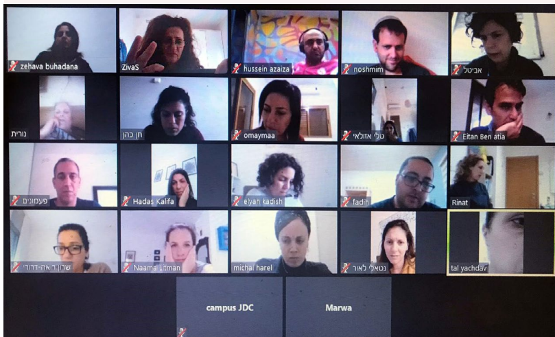
איך אפשר בלי...זום צוותים מחוזיים

בכל המחוזות ובצוות הארצי, הצוותים ציינו את ראש השנה במפגשים פרונטליים שהיוו הזדמנות לשיחה, תמיכה ועיבוד של החוויות, הרגשות והחששות שמלווים את כלנו.