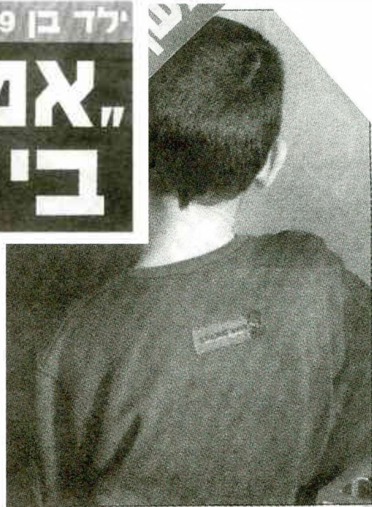
האב היכה את הבן בחלקי גופו חשונים

ילדת בת 4 באיזור המפון נפלה קורבן לתעללות מינית. לפני יומיים הגיעה אמה של הילדה למשטרה, ומספרה כי היא חושדת שסכסכו כיצע מעי סיום מנונים בבתה, הבת שלו התחילה להתנהג בצורה לא רגילה, שאלתי אותה מה קרה, היא סיפרה שהיטכן עשה לה משהו – ואו התי וילדה לבבנות, סיפרה האם. השכן החשוד נעצר לחקירה, מהמשפחה נמסר כי במהלכה הוא קישר את עצמו לחשי דות. הדובר במספר מדעני של פעוטה שנפלה,