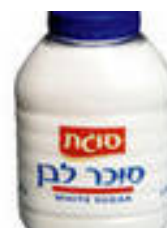
סוכר לבן של סוגת בצנצנת לבן של סוגת בשקית