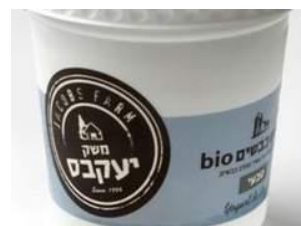
יוגורט עיזים טבעי של יעקב עיזים לשתייה של גד