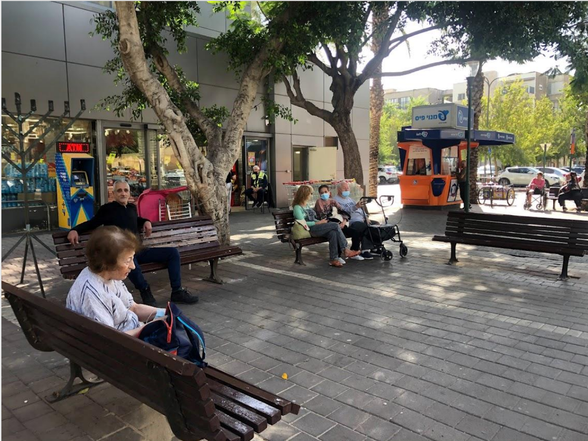
מרחב ישיבה ומפגש מוצל ונגיש במרכז המסחרי בעיר, קרית ביאליק.

זאת ועוד, חשוב לתת את הדעת לכך שסביבת חיים איכותית מתהווה לא רק מעצם תכנון המרחב הפיזי, אלא גם ביחס לעיצוב, פיתוח, תחזוקת וניהול המרחב אשר יכולים לתמוך, או לחלופין להגביל, את החיים הקהילתיים. כך למשל, עירייה יכולה לעודד פעילות קהילתית ולסייע ליוזמות Bottom-Up באמצעות ניהולו של המרחב הציבורי. העירייה יכולה לתפקד במקרה זה כמאפשרת, יזמית ו/או מבצעת בכוחות עצמה. לדוגמה, אספקת פלטפורמה דיגיטלית שמאפשרת לקבוצות מסוימות "לשריין" במועדים ספציפיים את הגינה הציבורית הקרובה לביתם לטובת פעילות ייעודית; העברת תכנים מגוונים בידי מפעילים עירוניים במרחבים הציבוריים לשם הפיכתם למזמינים לתושבים השונים; עידוד התושבים לטפח את המרחב ולהקים גינות קהילתיות; לאפשר למוסדות חינוך לקיים חלק מהפעילויות שלהם בשטח ציבורי פתוח בסמוך למבנה המוסד ("כיתת חוץ"); הקמה ותפעול של מחסנים משותפים לצעצועים, ציוד ועוד.