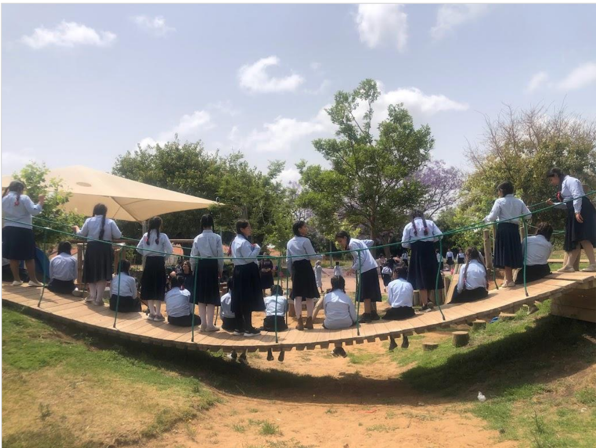
גן הציפורים, פרדס חנה כרכור. אתר חקלאות עירוני המטופח בהובלה משותפת של המועצה המקומית ותושבי הקהילה.

מוסדות אלה לא יכולים לקום יש מאין, אלא דורשים עבודה תשתיתית על ידי אלה המבקשים לארגן את הקהילה. מוסדות קהילתיים אלה יכולים להיות להתארגן סביב מספר צירים: האחד, ארגונים מבוססי שכונה או קהילה. השני, ארגונים מבוססי מוסד (לדוגמה: מרכז קהילתי, בית כנסת, מוסד אקדמי, בית ספר), שלוקח אחריות על ארגון הקהילה. והשלישי, ארגונים מבוססי נושא – דיור, שירותי בריאות, שוויון מגדרי, חינוך ועוד – בה יכולים לאגד אנשים שאינם גרים באותה שכונה. למרות השונות בין אופן ההתארגנות של המוסדות השונים, דרכי הפעולה שהוזכרו לעיל הן זהות.