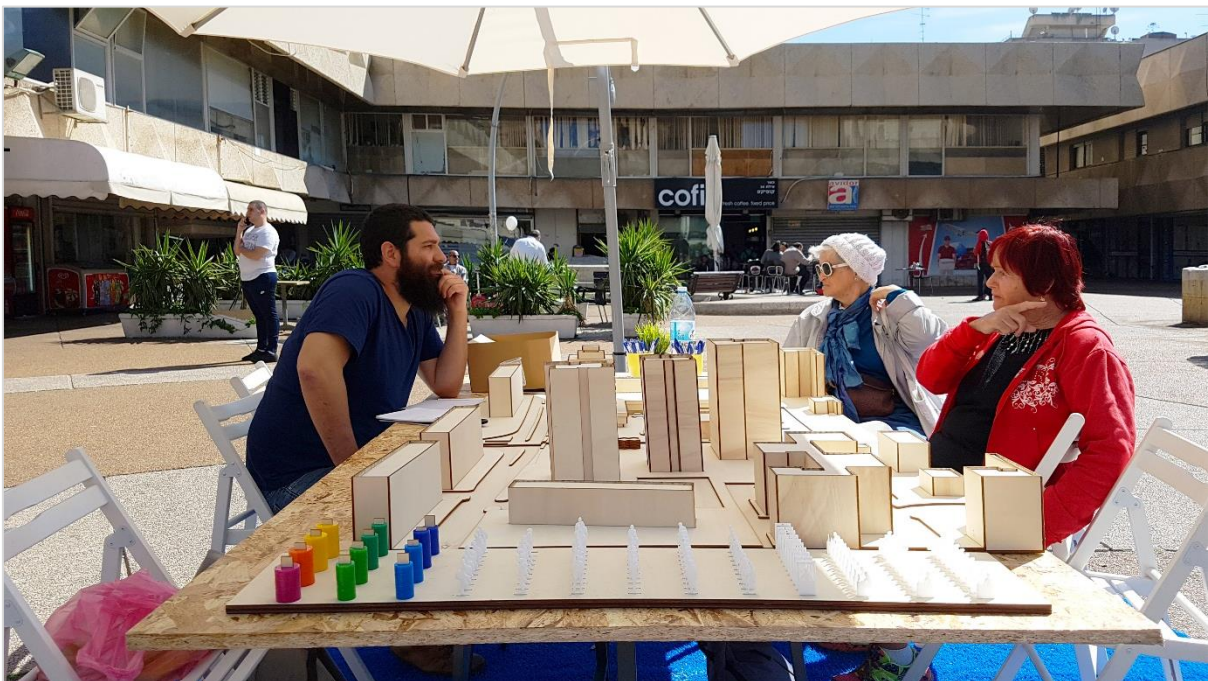
שולחנות תכנון משתפים במרחב התכנון. התחדשות המרכז המסחרי סירן, נאות רחל, חולון.

קידום הקהילה המיטיבה באפיק האורבני-פיזי מתבסס על שלושה רבדים: (א) עיצוב תהליכי תכנון ופיתוח קהילתיים – קידום קהילות חסונות ובנות קיימה; (ב) בניית יחסים ושותפויות בין הקהילות לבין מחזיקי עניין שונים – פעולה קולקטיבית לשינוי חברתי; ו- (ג) קידום תוצר רצוי – תכנון, פיתוח, עיצוב, ניהול ותחזוקה של סביבת חיים עירונית איכותית. חלוקה זו היא לצורך ההצגה בלבד, בעוד שבמציאות שלושת הרבדים הללו של האפיק האורבני-פיזי שלובים זה בזה. בפרקים הבאים נרחיב על כל אחד מהרבדים.