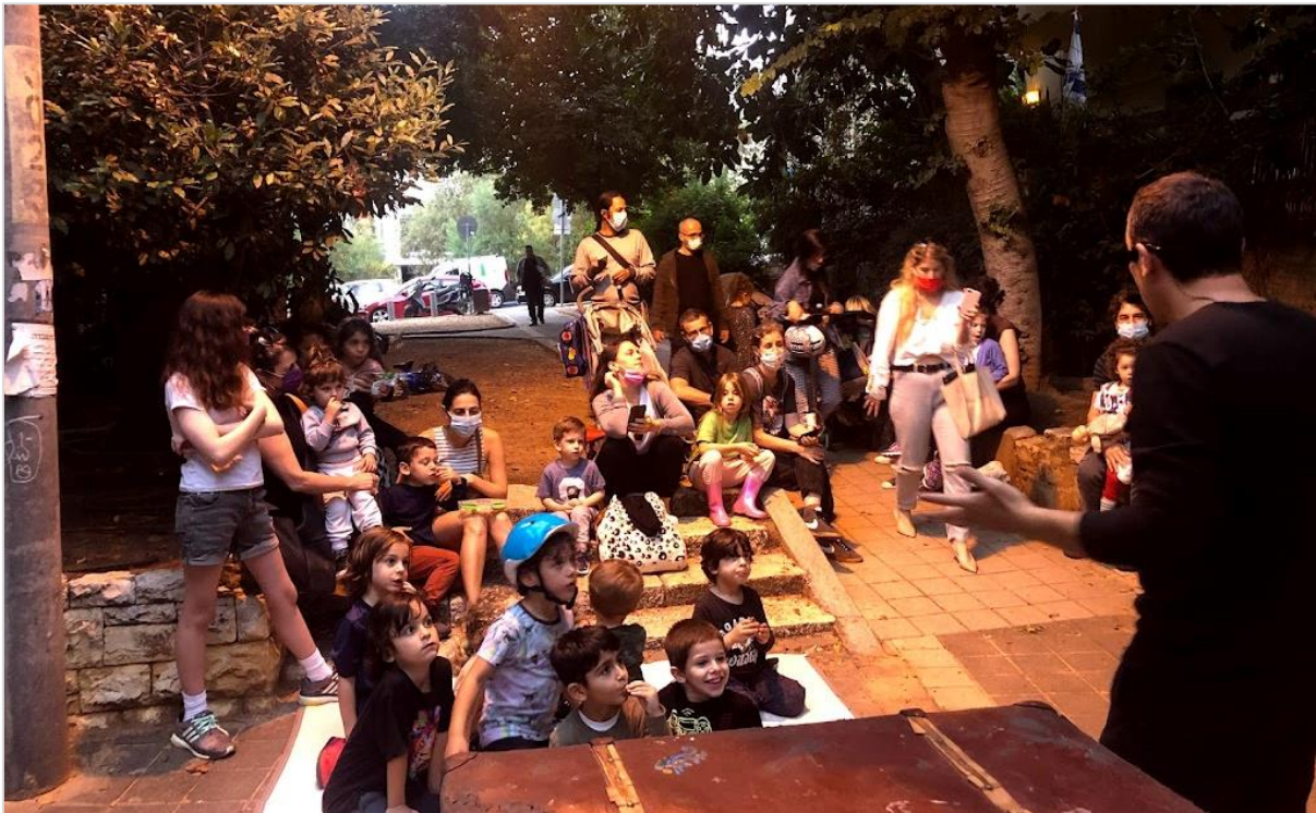
הצגת ילדים במרחב השכונתי הפתוח בארגון הרשות המקומית, תל אביב יפו.

חשוב לזכור כי סביבת החיים של הפרט ושל הקהילה מתהווה מתוך תהליכים של תכנון, עיצוב, פיתוח, תפעול, תחזוקה וניהול . כך למשל תהליך תכנון שנעשה בהשתתפות מלאה של התושבים, "עבור הקהילה – עם הקהילה – על ידי הקהילה", משפיע לא רק על התוצר הפיזי אלא גם על תחושת המסוגלות של חברי הקהילה או על המשאבים העומדים לרשותה; או לדוגמה, אם נבחן את דפוסי השימוש בגינה הציבורית ומידת שביעות הרצון של המשתמשים נגלה כי היא אינה תלויה רק בעיצוב מתקני המשחק או רשת השבילים, אלא גם בתחזוקה השוטפת שלהם ושל הגינה כולה; דוגמה נוספת היא הפעילות שהעירייה מקיימת בכיכר העיר או במרכז הקהילתי, אשר יש ביכולתה למשוך קהל מגוון – החל מהפעלות ייעודיות לגיל הרך וכלה בזקנים וזקנות, וכך הלאה. פועל יוצא של החשיבה המרחיבה על קשרי הקהילה וסביבת החיים הוא גם ההכרה בחשיבותו של המרחב הווירטואלי להבנייתה של הקהילה. מרחב זה מהווה הרחבה של סביבת החיים הפיזית וגם הוא מהווה זירה משמעותית להתרחשות הקהילתית 11 .