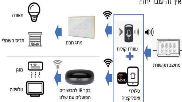
איך זה עובד יחד?

2. מורכבות לעומת פשטות - מידת המורכבות תלויה ביכולות האישיות של האדם (קוגניטיבי, מוטורי ועוד) וברקע הטכנולוגי שלו מצד אחד ובמורכבות המוצר מצד שני. לדוגמה, משתמש הנותן פקודה להדלקת הטלוויזיה לעוזרת הקולית באמצעות לחיצה על פלט קולי. מבחינת המשתתף, היישום - לחיצה על פלט קולי, הוא פשוט ומוכר, והתוצאה מגבירה את יכולתו לאוטונומיה ועצמאות. במקרים שבהם איננו מצליחים לסייע לאדם לתפעל את הפתרון בעצמו, אנו מאתרים במשפחה "ממונה טכנולוגיה" שעליו מוטלת האחריות על ניהול הממשק.